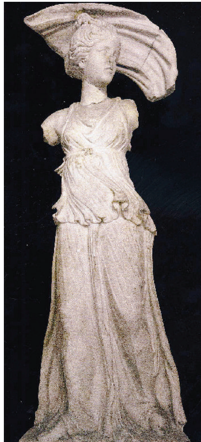
«Selene», statua conservata al Museo archeologico di Istanbul: l'immagine è tratta dal libro Jaca Book a cura di Tania Velmans

Anche dopo il silenzioso crollo dell'impero a Occidente la sua cultura raggiunse quelle che Braudel ha chiamato le «zone spaziodinamiche d'irradiazione» che consentono di capire meglio una civiltà. Spaziando nelle distese del sincretismo, il prezioso volume III del Manicheismo pubblicato dalla Fondazione Valla raccoglie inedite perle dello gnosticismo asiatico e microasiatico, in cui il manicheismo e lo zoroastrismo, il cristianesimo e il buddhismo si fon-