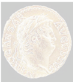
Moneta con il profilo di Nerone

Nerone non era quel mostro che vorrebbero farci credere gli storici, a cominciare da Tacito e Svetonio, due calunniatori per partito preso. Aveva notevoli qualità artistiche e coltivò fin da ragazzo diverse branche dello scibile. Sotto il suo principato ci fu un vero rifiorire delle arti e della cultura in genere. A Nerone va anche il merito di non aver fatto guerre e di aver aiutato il più possibile i meno fortunati. Il fatto che sulla sua tomba,