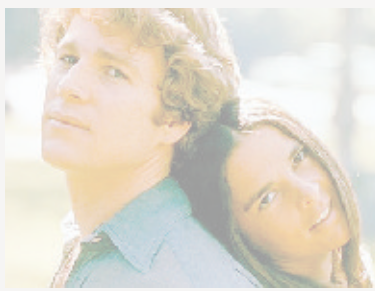
Ryan O'Neal e Ali MacGraw in Love Story

Addio a Segal, amare significa piangere senza vergogna