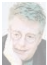
LARSSON “Millennium, Stieg ed io” è il libro di Eva Gabrielsson in uscita in Svezia e in Francia

Al “Sunday Times” una copia in anticipo del libro della Gabrielsson che sostiene: “Esistono solo 200 pagine inedite e posso dire che spesso abbiamo scritto insieme”