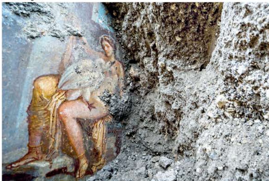
L'affresco di Leda e il cigno ritrovato a Pompei